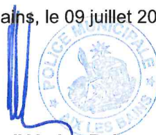
Le Maire d'Aix-les-Bains Renaud BERETTI